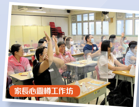
家長心靈樽工作坊